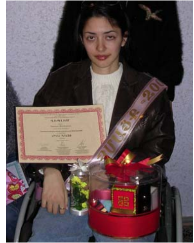
Միսս Նմայք (2-րդ մրցանակ)

Կազմակերպիչները երախտապարտ են «Ջիզզազ» ընկերությանը, որը տրամադրել էր Գրան պրիի՝ «Grundig» ֆիրմայի CD-ով ռադիոմագնիստֆոնը, «Նուշիկյան սաոցիալա-»-ին, որը տրամադրել էր մյուս երեք մրցանակները՝ աշխարհահռչակ ֆիրմաների (Gucci, Chanel, Yves saint Laurent, Roxas և այլն) կոսմոպոլիայի և օժանելիքի հիանալի հավաքածուները: