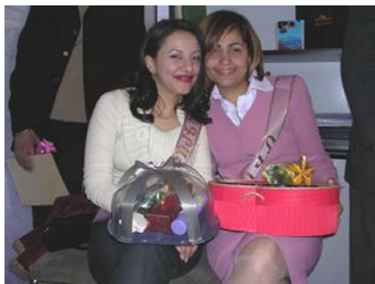
Միսս Ժպիտ (1-ին մրցանակ) և (աջից) Միսս Գրացիա (3-րդ մրցանակ)