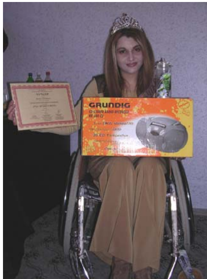
Միսս Գեղեցկություն (Գրան պրի)