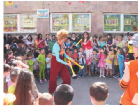
2010թ. հունիսի 1-ին՝ երեխաների միջազգային օրը, «Ունիսոն» ՀՀ-ն աջակցեց Մալաթիա-Սեբաստիա վարչական շրջանի ներառական մանկապարտեզներում տոնական միջոցառումների անցկացմանը